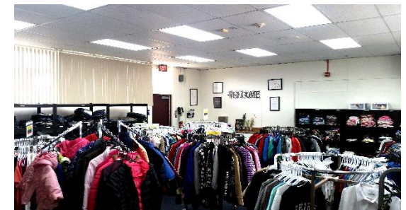
Community CARE Closet

The District's Community CARE Closet is located on the Adult School campus. CVUSD students and families are able to "shop" at no cost for gently used clothing, emergency hygiene items, & school supplies. Please call for an appointment.