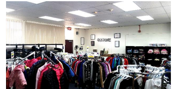
Community CARE Closet