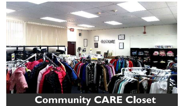
Community CARE Closet

學區的社區關懷壁櫥位於成人學校校園內。CVUSD 學生和家庭可以免費取用二手衣物、緊急衛生用品和學習用品。請致電預約。